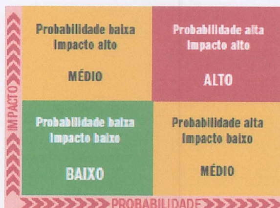
Figura 01 - Matriz de riscos simples

12.1.3. Para a análise de risco será utilizado o método qualitativo, que define o impacto versus probabilidade e, também o nível da escala de risco por qualificadores numéricos que determinarão o método qualitativo como: BAIXO, MÉDIO, ALTO, EXTREMO, facilitando com base na percepção das pessoas para análise. A relação entre os riscos e os seus componentes pode ser ilustrada por meio de uma matriz que se correlaciona com as variantes impacto e probabilidade; segue-se a imagem abaixo: